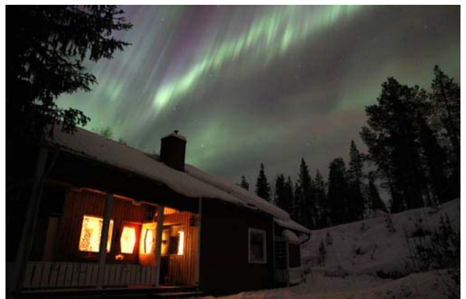
▲キルナ郊外ロッジで撮影(2012年11月)

夜間の撮影時は撮影機材の防寒対策が必要となりますので、ツアーお申込後にお渡しする資料を参考の上でご準備ください。